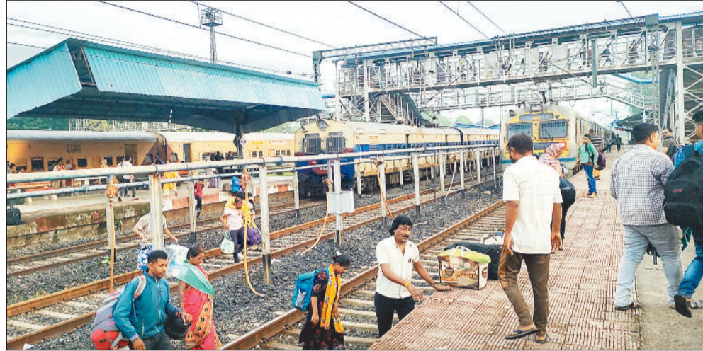
यात्रियों को हो रही परेशानी।

क्षेत्र की जागरूक जनता अब सवाल पूछ रही है क्या एमसीबी जिले के लोगों को राजधानी जाने का हक नहीं। क्यों नहीं मिल पा रही है सीधी ट्रेन सुविधा। चिरमिरी-बिलासपुर एक्सप्रेस को दुर्ग तक क्यों नहीं बढ़ाया जाता। रीवा ट्रेन को सप्ताह में सातों दिन क्यों नहीं चलाया जा रहा। ▶▶शेष पेज 4 पर