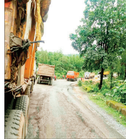
हरिभूमि न्यूज ►► बलराजपुर

एनएच 343 की हालत बेहद खराब हो चुकी है। गड्ढों में तब्दील हो चुकी सड़क के कारण लोगों का आवागमन मुश्किल हो गया है। बारिश में गड्ढों को भरने डाले गए मुरुम के कारण स्थिति और भी खतरनाक हो गई है और वाहनों के पहिए कीचड़ में फंसने से जाम की स्थिति