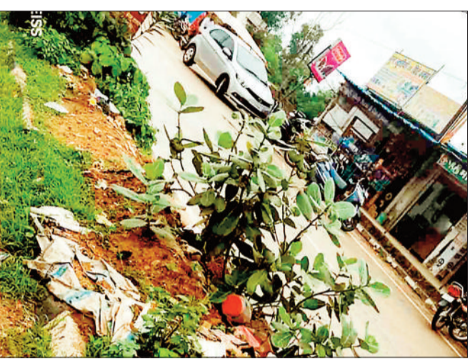
डिवाइडर में फेंका गया कचरा।